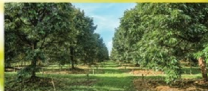
สวนคุณอุดมทรัพย์ จ.จันทบุรี (80 ไร่)