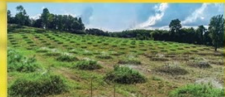
สวนสามพี่น้อง จ.จันทบุรี (50 ไร่)