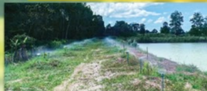
สวน Siam Profruit จ.จันทบุรี (60 ไร่)