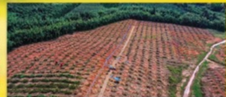
สวน 500 ไร่ จ.จันทบุรี