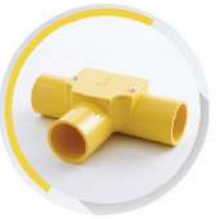
สามทาง ฝาเปิด ร้อยสาย 18-25 มม. (1/2"-1")