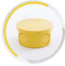
กล่องพักสายกลม ร้อยสาย 15-18-20 มม. (3/8"-1/2"-3/4")