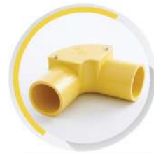
ข้องอ 90° ฝาเปิด ร้อยสาย 15-25 มม. (3/8"-1")