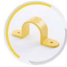
ก๊อปปี้ ร้อยสาย 18-55 มม. (1/2"-2")