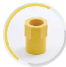
ข้อต่อเข้ากล่อง ร้อยสาย 15-55 มม. (3/8"-2")