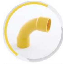
ข้อโค้ง 90° ช่วงสั้น ร้อยสาย 15-25 มม. (3/8"-1")