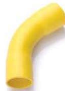
ข้อโค้ง 45° H ขาน2 ร้อยสาย 15-100 มม. (3/8"-4")