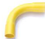
ข้อโค้ง 90° H ขาน2 ร้อยสาย 15-100 มม. (3/8"-4")