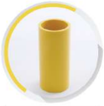
ข้อต่อตรง ร้อยสาย 15-100 มม. (3/8"-4")