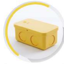
กล่องพักสายสี่เหลี่ยม 4"x2" ร้อยสาย 15-18-20 มม. (3/8"-1/2"-3/4")