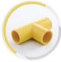
สามทาง ร้อยสาย 18-25 มม. (1/2"-1")