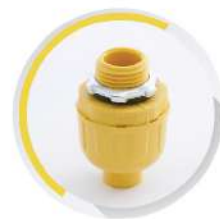
ข้อต่อท่ออ่อนสายลูกฟูก 15-25 มม. (3/8"-1")