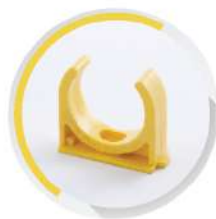
คัลลิป้ามปู ร้อยสาย 15-55 มม. (3/8"-2")