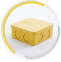
กล่องพักสายสี่เหลี่ยม 4"x4" ร้อยสาย 15-18-20 มม. (3/8"-1/2"-3/4")